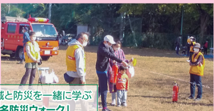
地域と防災と一緒に学ぶ 「愛名防災ウォーク」

恒例の秋のふれあい祭りと防災訓練を合体させた防災イベントとして、昨年11月6日に「愛名防災ウォーク」を開催しました。住んでいる地域を歩き、避難経路の再確認と防災施設の体験を行いました。ゴールでは防災に関する展示や消火器体験、消防車の見学、非常食の配布も。これからも様々な企画を予定しています。