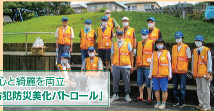
安心と綺麗を両立 「防犯防災美化パトロール」

コロナ禍でも、町内美化と防犯活動を融合した「防犯防災美化パトロール」を毎月2回実施しています。ポイ捨てゴミの減少と道路状況の改善につながっています。町内花壇も年2回植え替えています。自治会員の親睦を深める夏まつりやバス旅行、賀詞交歓会(どんど焼き)など、時代に合った考えも取り入れています。