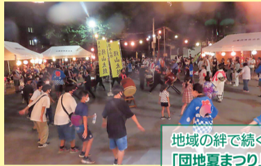
地域の絆で続く 「団地夏まつり」

昨年7月23日、伝統の「団地夏まつり」を3年ぶりに開催しました。感染対策として規模を縮小したものの、地域の子どもから大人まで多くの方が来場し、盆踊りでは、小学生や中学生もたくさん輪に加わり、盛り上がりは最高潮!「笑顔・楽しさ・地域の絆」を追求しながら、活動を行っています。