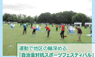
運動で地区の輪深める 「自治会対抗スポーツフェスティバル」

コロナ禍前に開催していた自治会対抗地区大運動会を、「自治会対抗スポーツフェスティバル&大抽選会」として昨年10月9日に開催しました。誰でも気軽に参加できる競技にすることで、200人を超える方に参加いただき、大きな笑い声が響きました。コロナに負けないように「地域の輪を深める試み」を続けていきます。