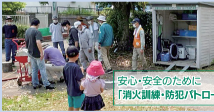
安心・安全のために 「消火訓練・防犯パトロール」

消火訓練と防犯パトロールを実施しています。初期消火訓練は昨年も2回実施。小型消防ポンプや消火栓による放水訓練で、いざという時に慌てないように備えました。防犯活動では、隔月でパトロール。不審者や不審車両のチェックや防犯灯の点検など、安心・安全への取り組みは地道ですが自治会活動の本道として、取り組んでいます。